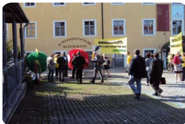
Greenpeace agiterer for bæredygtigt opdræt

Vi blev i øvrigt modtaget pænt modtaget af Greenpeace, som benyttede lejligheden til at præsentere deres budskaber.